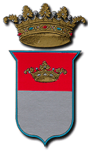
PROVINCIA DI AVELLINO